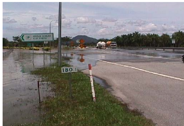
Air melimpahi di lebuhraya utara selatan