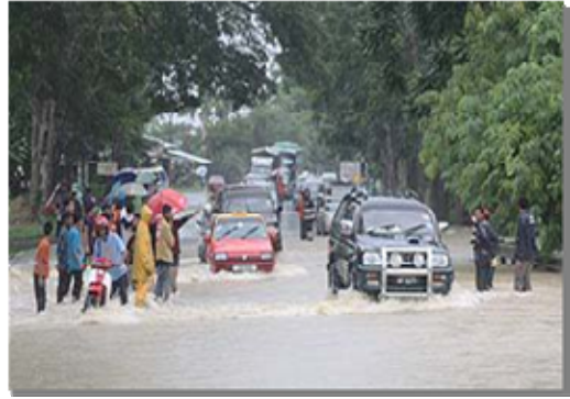
Jalan raya yang dibanjiri air merbahayakan penggunaan