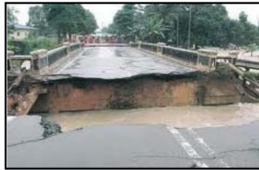
Jalan terputus akibat banjir yang melanda