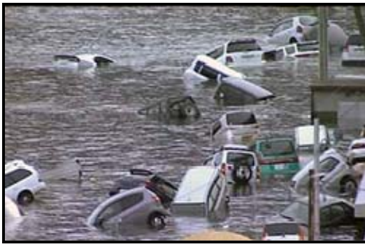
Banjir mengakibat kenderaan hanyut

Enam inci air yang berarus deras boleh menjatuhkan seorang dewasa manakala air berkedalaman sekaki yang berarus deras boleh menghanyut sebuah kenderaan.