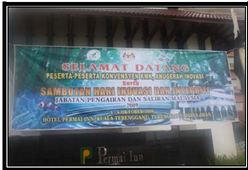
Banner yang dipasang sepanjang majlis berlangsung