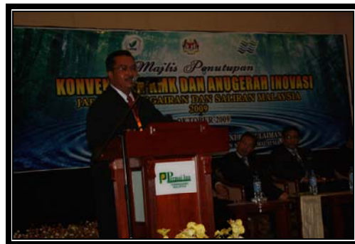
Ulasan daripada Ketua Panel Penilai