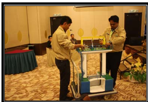
Demonstrasi penggunaan alat daripada kumpulan CHAIN