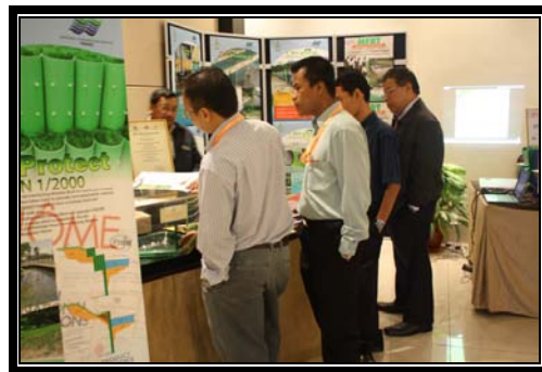
Pameran dari program inovasi yang telah berjaya