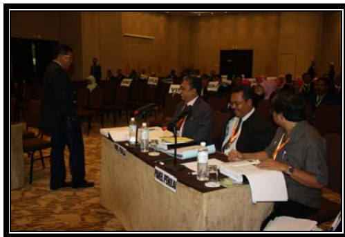
Barisan Panel Penilai