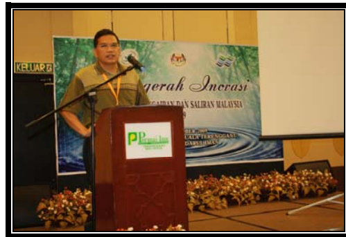
Taklimat pada malam sebelum Anugerah Inovasi