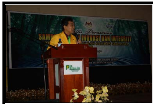
Ceramah yang disampaikan oleh HM Tuah Iskandar