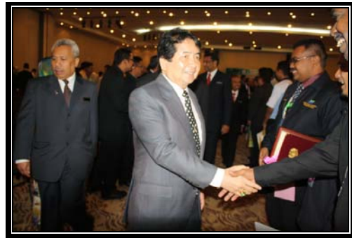
Kehadiran Y. Bhg. Timbalan Menteri NRE