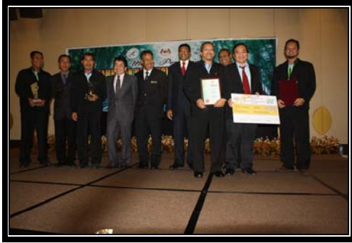
Johan Kategori JPS Bersama Swasta