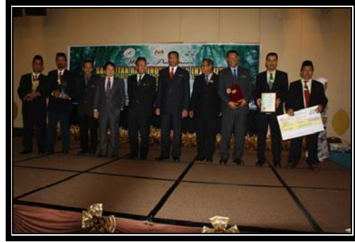
Johan Kategori Bukan Teknikal / JPS