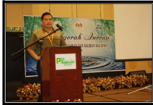
Taklimat pada malam sebelum Anugerah Inovasi