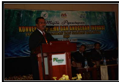
Ulasan daripada Ketua Panel Penilai