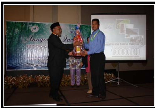
Penyampaian Cabutan Bertuah yang disediakan oleh JPS Terengganu