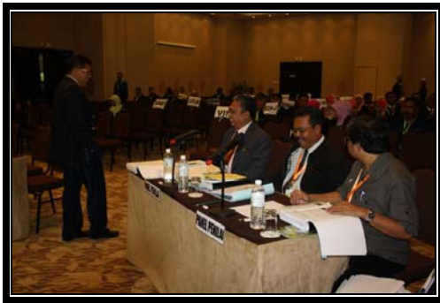
Barisan Panel Penilai