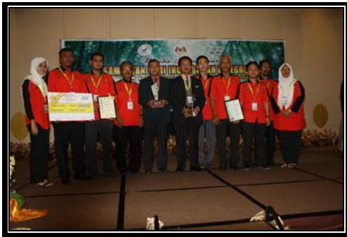
Johan Kategori Teknikal / JPS