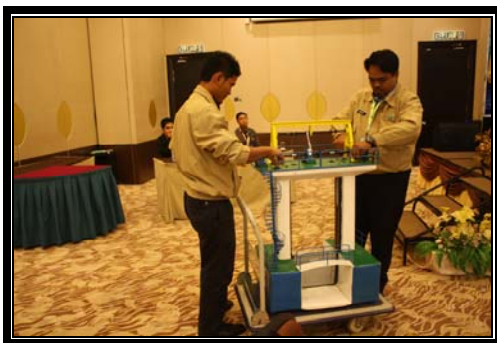
Demonstrasi penggunaan alat daripada kumpulan CHAIN