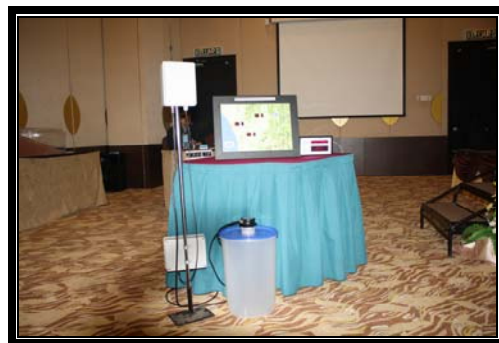
Model HAFIB System daripada JPS Kedah