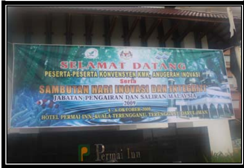
Banner yang dipasang sepanjang majlis berlangsung