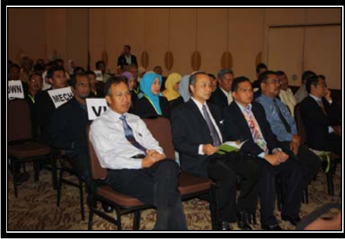
Kunjungan Y. Bhg. Dato' KP ke Persembahan Anugerah Inovasi