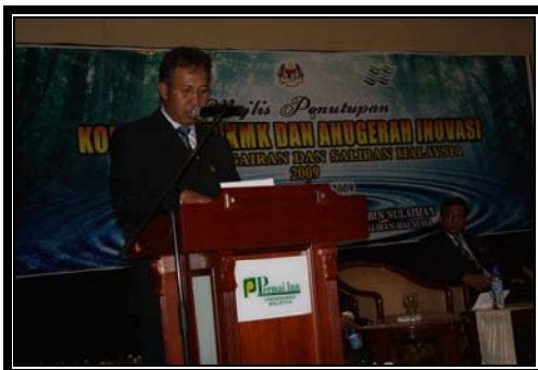
Ucapan Penutup oleh Y. Bhg. Dato' KP