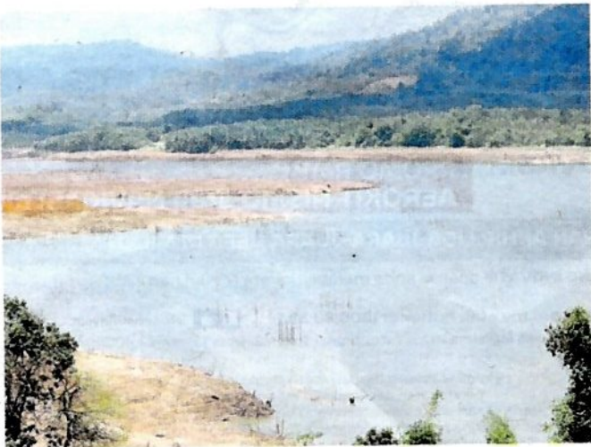
PARAS air di Tasik Beris yang membekalkan air ke Empangan Beris turut susut akibat cuaca panas.