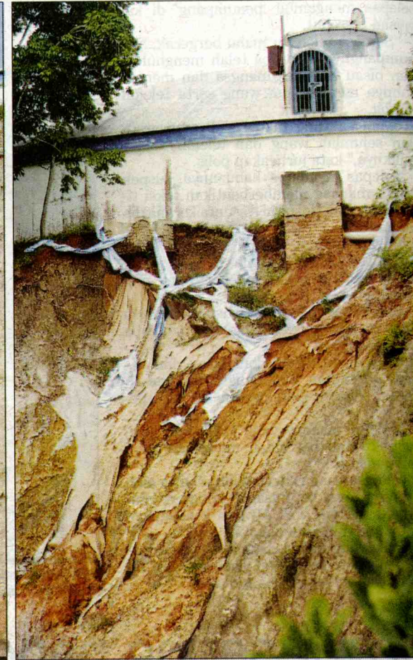
KEDUDUKAN Loji Air Bukit Losong yang tidak selamat disebabkan hakisan tanah.

Antaranya termasuklah kawasan Jalan Hiliran, Jalan Kuala Hi-